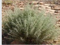
الشيخ يدمر الخلايا السرطانية