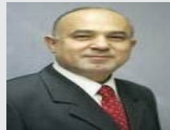
الاردن مقبل على مرحلة صعبة