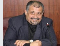
بانتظار مفاجأة رفع رواتب الموظفين