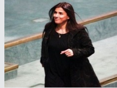
النائب الفايز تعتذر