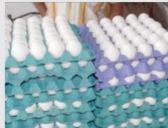
انخفاض اسعار بيض المائدة محليا