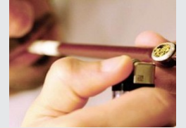
دائرة الجمارك تحظر استيراد وتداول المدواخ