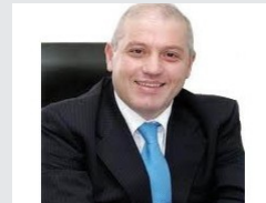
ثلاث نتائج لدخول الجيوش البرية إلى سورية